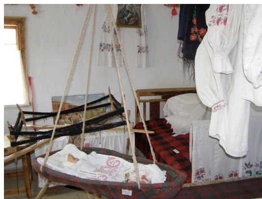
с.Жабелівка. "Народний" музей-будинок побуту