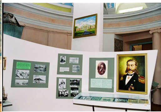
Музей авіації та космонавтики України

Початок експозиції знайомить відвідувачів з першими спробами людини оволодіти небесами. Ще у XV ст. геніальний Леонардо да Вінчі почав розробляти теорію польоту людини. 1475 р. він сконструював апарат вертикального злету (представлено схему апарату Леонардо да Вінчі).