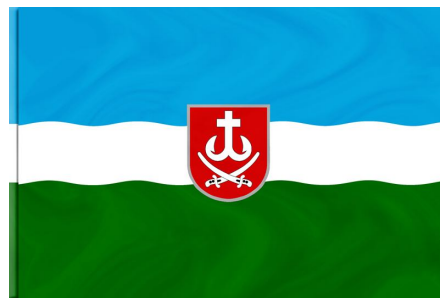
Прапор Вінницького району