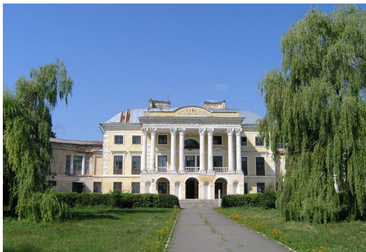
Палац Грохольських-Можайських XVIII ст.

То ж мальовниче селище Вороновиця, розташоване за 20 км від Вінниці, по праву зветься колискою авіації. Нині дві зали колишнього палацу Грохольських займає музей історії авіації і космонавтики ім. Можайського. Експозиція музею розповідає про розвиток вітчизняного повітряного флоту, про перших авіаторів і їхні рекорди. Експонати відображають велику роль авіації у Великій Вітчизняній війні, розповідають про перші кроки людства в космос, про талант винахідників і мужність льотчиків-випробувачів.