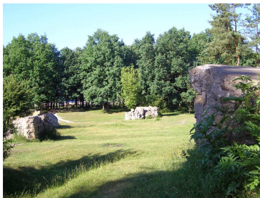
Поряд із Вінницею, поблизу села Стрижавка. Залишки ставки Гітлера "Вервольф".

Фашистська навала творила в краї нечувані злочини: розстрілювали людей, грабували мирне населення. У зв'язку з тим, що 1941 р. у Коло-Михайлівському сосновому лісі почалося будівництво надсекретного об'єкта, який згодом отримав назву – ставка Гітлера «Вервольф», тут зосереджувалося чимало есесівських частин, загонів гестапо.