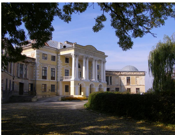
Палац Грохольських-Можайських XVIIIст.

Загальний вигляд палацу нагадує розігнуту підкову (крила). Він розташований на найбільш високій точці місцевості. При допомозі широко розставлених напівовальних крил, будинок наче «обіймав» тих, хто наближався до палацу. По периметру крила створений орнамент із гірлянд плодів і квітів, який чергується з бичачими черепами – мотив далекого язичного минулого. Палац триповерховий, складається із 43-х кімнат і збудований у стилі раннього класицизму епохи Палладіо – палаці з легко вигнутими боковими крилами. Можливим архітектором був Д. Мерліні, який в 1774 -1777 рр. вважався королівським архітектором і розробляв проекти палаців польським магнатам, проживаючим в Україні.