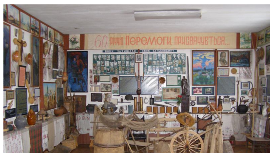
с.Оленівка. "Народний" музей історії села