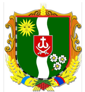
Герб Вінницького району

В обіймах Вінницю тримає Могутній Вінницький район, Й вона все краще розквітає Намистом калинових грон. Плодами й зелом він рясніє, Талантів джерелом струмить.