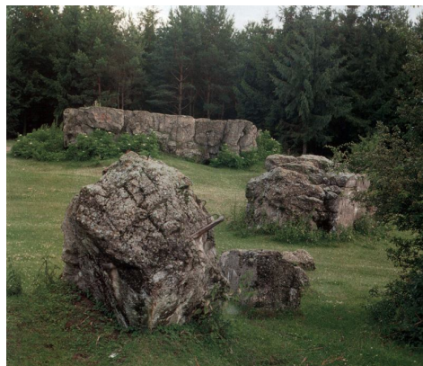
Поряд із Вінницею, поблизу села Стрижавка. Залишки ставки Гітлера "Вервольф".

Збудована вона була просто в рекордні терміни – з вересня 1941 р. по квітень (за іншими відомостями – по червень) 1942 р. Кожен із 13-ти секторів оточений мінними полями, 2-метровою огорожею з колючого дроту та лінією високої напруги. Понад 80 житлових і службових приміщень тільки частково розташувалися на поверхні (в т.ч. – особистий будинок Гітлера та мармуровий басейн, де він купався разом з Євою Браун). А під землею містилося аж 7 поверхів, причому стіни герметичних приміщень були завтовшки 5 м, а перекриття – 8 м, все це оснащено унікальними дренажними, повітро-фільтраційними системами та автономним енергозабезпеченням! Тут були величезні продуктоховища, воду видобували з артезіанських джерел. Одним словом, «Вервольф» міг спокійно витримати наземний ядерний вибух, протягом десятиліть забезпечуючи роботу в автономних умовах не однієї сотні осіб.