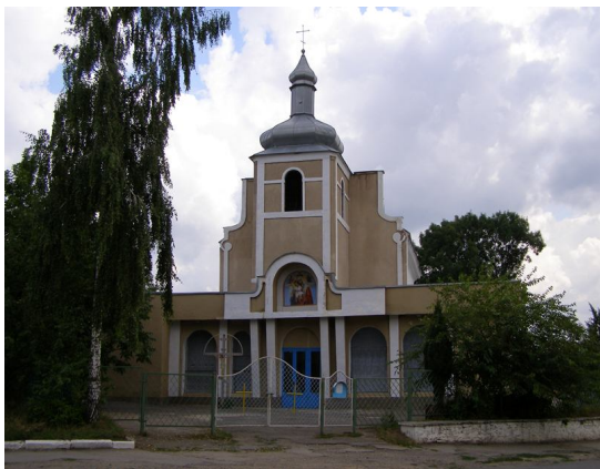
Різдово-Богородицький храм - 1777 року. смт Вороновиця.

Тут виріс поет Кесар Андрійчук, художник Іван Каниболоцький, Герой Радянського Союзу Григорій Олійник. Тривалий час жив і творив М.Старицький.