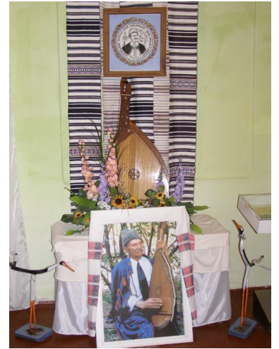
Музей кобзара В Перепелюка

Народним співцем він став уже від того дня 1939 р., коли написав свою першу пісню на слова Т.Шевченка «Нема гірше, як в неволі про волю згадати...», яку він виконав на святкуванні чергового ювілею Великого Кобзаря у Вороновиці. Відтоді вона увійшла назавжди до класики українського кобзарства, піднявши Перепелюка на високу творчу орбіту.