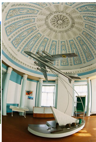
Музей авіації та космонавтики України