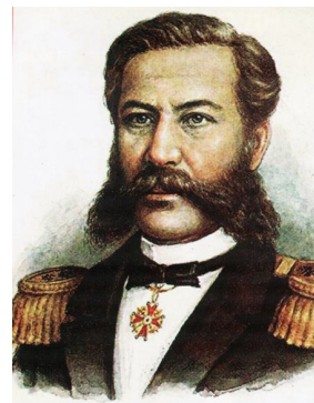
Олександр Федорович Можайський

За період життя у Вороновиці, Олександр Федорович крім того, що займав посаду Брацлавського мирового судді, ще й виконав значну роботу, яка передувала побудові повітроплавального апарату. Він проводив досліди з птахами, вивчаючи умови горизонтального польоту, моделює велетенські повітряні змії. Саме, проживаючи у Вороновиці, Можайський виготовляє свою першу модель. Для її випробовування Олександр Федорович обрав високий пагорб на березі річки Південний Буг біля с. Потуш, що в урочищі «Дубина», де знаходилася дача Можайських. Планер прив'язували довгим мотузком до трійки коней. Коли коні починали швидко тягти воза, особливо з гори, планер злітав у повітря і рухався за возом, при зменшенні швидкості апарат знижувався і котився на своєму візку. Польоти на повітряному змії дали можливість О. Ф. Можайському правильно визначити розміри підйомної поверхні літального апарату.