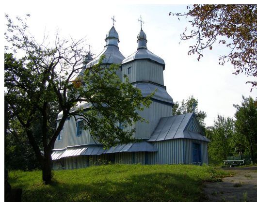
Михайлівська церква-1752 року. смт Вороновиця-Ганщина.

Цінною архітектурною пам'яткою місцевості є й дерев'яна Михайлівська церква, збудована у 1752 р. стараннями прихожан. Приваблює її своєрідний зовнішній вигляд: тризуба, триверха, складається з трьох восьмигранних зрубів, які перекриті бароковими банями, увінчаними декоративними главами із хрестами. Освячена на честь Чуда Святого Архистрига Михаїла. Церкву прикрашає дерев'яний, п'ятиярусний, різьблений, позолочений іконостас XVIII ст. Живопис на іконостасі виконували талановиті народні майстри.