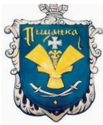
Герб Піщанського району

Піщанський район межує з молдовським Придністров'ям. Саме тому калинове гроно національної культури й побуту місцевих українців тісно переплітається з виноградною лозою молдовських традицій. Район невеликий за площею, але з неповторним ландшафтом, флорою, творчістю народних умільців, пам'ятками архітектури. Чого варта тільки історія палацу панів Чарномських, що у мальовничому с. Чорномин.