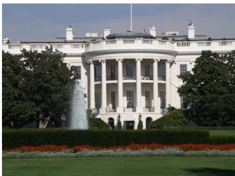
Фрагмент Білого дому в США

Прямокутна будова з шестиколонним іонічним портиком з одного боку і напівкруглим ризалітом, що прикриває салон, оточений вісьмома колонами, – з другої сторони. Від великої групи палаців, розсипаних по території бувшої Речі Посполитої, Чорноминський палац відрізняється двома невеликими особливостями.