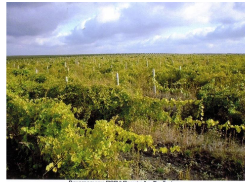
Виноградники ПСП "Промінь" с. Трибусівка