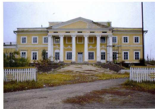
Чорноминська ЗОШ І-ІІІ ступенів. Пам'ятка архітектури ХІХ століття - "Палац графів Чорномських"

На живописному пагорбі над селом Чорномин (колись Розбійна) височить старовинний палац. Його високі стрімкі колони сягають неба і підтримують сріблясту баню будівлі. Сонячне проміння, відбиваючись на опуклому даху, сяє ореолом над усією спорудою. Великі широкі вікна спокійно й мовчазно дивляться у двір із висоти своїх стін як німі свідки віків і тих подій та людей, що причаїлися в стінах цього архітектурного шедевр.