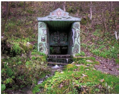
Державний заповідник, урочище "Княгиня". Центральне джерело

сімейному склепі. В народі й досі пам'ятають її доброзичливе ставлення до місцевих селян, а побудованими нею чотирма водяними млинами користувалися аж до 1956 р. Щоправда, палац в якому вона жила, більшовики знищили відразу як захопили владу. Не змогли вони здолати лише склеп – його руїни збереглися до сьогоднішнього дня, але куди з нього поділося тіло княгині, ніхто не розслідував.