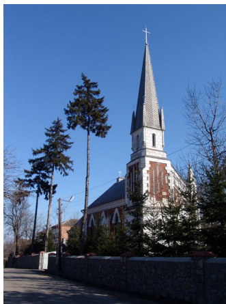
Костьол св. Олексія 1910р., вул. Одеська

площу розтікається хвилями ландшафту суцільне подільське село. Сільська частина Жмеринки здається теж досить веселою – чимало оновлених будиночків, які хатами вже не назвеш, асфальт, є навіть довоєнна бруківка на крутому узвозі. А посередині причаївся готичний шпиль увінчаний 5 хрестами красивого католицького костьолу, оточеного сторічними соснами.