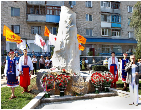
Відкриття пам'ятного знаку Т.Г.Шевченку