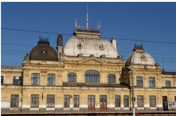
Залізничний вокзал ст. Жмеринка вул. Вокзальна