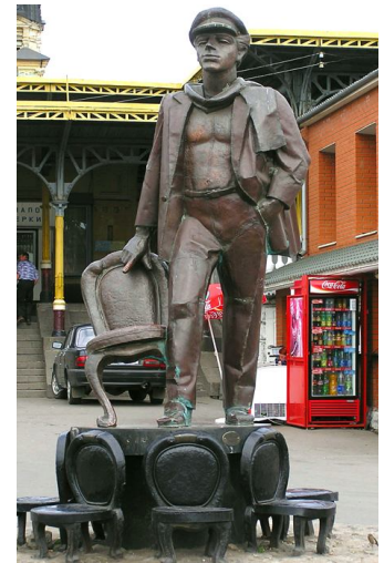
Пам'ятник О.Бендеру, літературному герою І.Ільфа і Є.Петрова

Власне, обличчя Жмеринки формує прилеглий до вокзалу веселий квартал центру (кольорові дво- і триповерхові кам'янички в стилі кінця 1940-х років та навколо центру – кільканадцять чималих дев'ятиповерхівок і «хрущовок», охайних, цілком «столичних» і всередині й по дворах. Усе це стоїть на найвищій точці пагорба. А вниз від тих висоток на значну