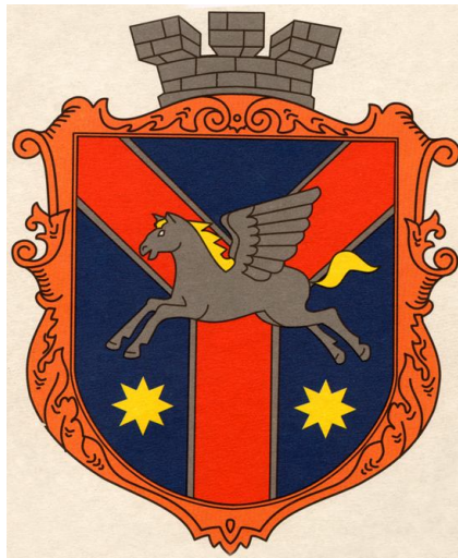
Герб м. Жмеринка

В чудову літню пору, подорожуючи на південь – до Чорного моря, до кримських і одеських курортів ви обов'язково проїжджатимете Жмеринку. Якщо не їдете до санаторію, а просто подорожуєте, зупиніться та зійдіть у Жмеринці. Вас чекає зустріч з цікавою історією, багатьма пам'ятками та пам'ятними місцями, які нагадують, що тут жили і творили відомі діячі літератури і мистецтва. Мальовнича природа доповнить ваші враження.