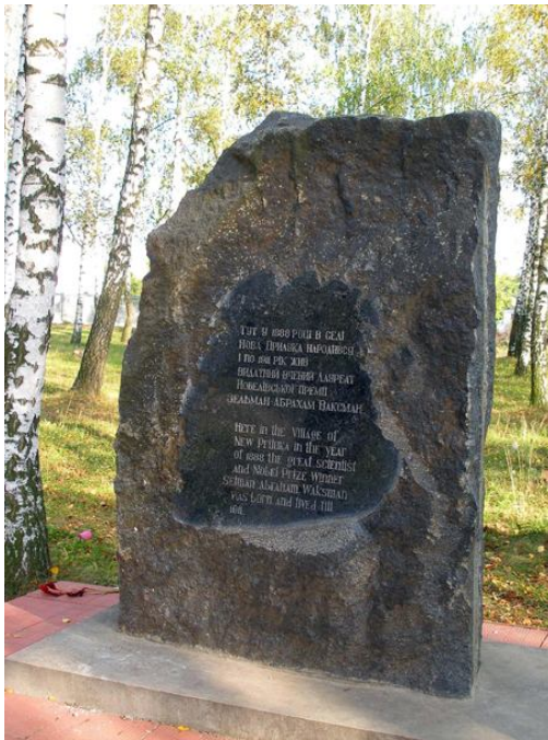
Пам'ятник Зелману Абрахам Ваксману