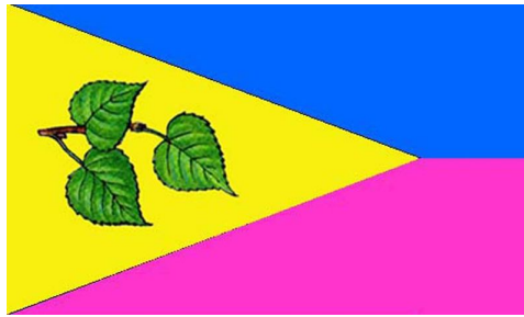
Прапор Липовецького району