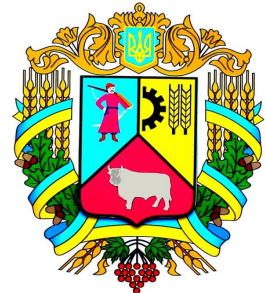
Герб Липовецького району

Липовеччина має славне історичне минуле, відома своїми трудовими та культурними традиціями, талановитими людьми – справжніми майстрами своєї справи.