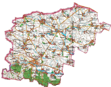
Мапа Хмельницького району