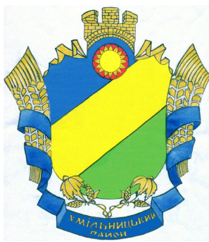
Герб Хмельницького району