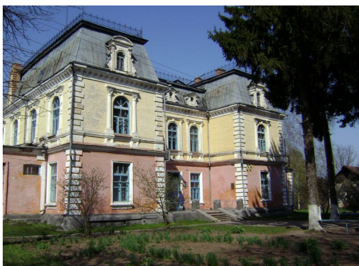
Палац, с. Спичинці