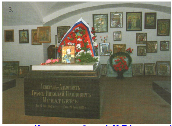
Крипта, у якій похований граф М.П.Ігнат'єв (1832-1908)

Закінчивши у 1882 р. службову кар'єру граф М. П. Ігнат'єв разом із сім'єю повернувся назавжди до свого родинного помістя в с. Круподеринці. Часто навідувався до Києва, бував на могилі Т. Г. Шевченка. А ще скуповував довколишні родючі землі над Россю і створював тут зразкові прибуткові промисли. Донині зберігся триповерховий цегляний млин, збудований графом.