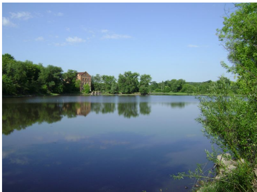
Млин на р.Рось

Закінчивши у 1882 р. службову кар'єру граф М. П. Ігнат'єв разом із сім'єю повернувся назавжди до свого родинного помістя в с. Круподеринці. Часто навідувався до Києва, бував на могилі Т. Г. Шевченка. А ще скуповував довколишні родючі землі над Россю і створював тут зразкові прибуткові промисли. Донині зберігся триповерховий цегляний млин, збудований графом.