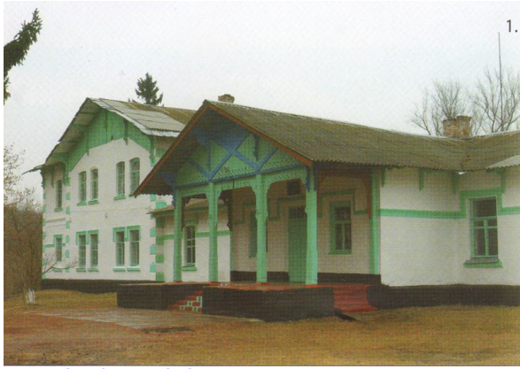
Садибний будинок помістя графа М.П. Ігнат'єва. Середина XIX ст.