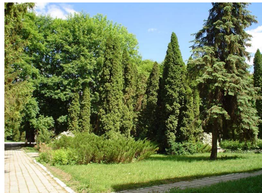
Парк військовий Хмільник