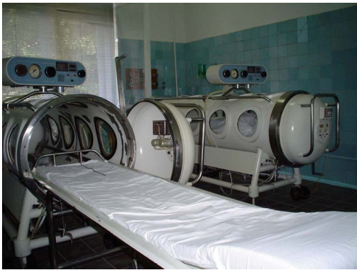
Баротерапія військовий Хмільник