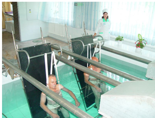
Клінічний санаторій Хмільник