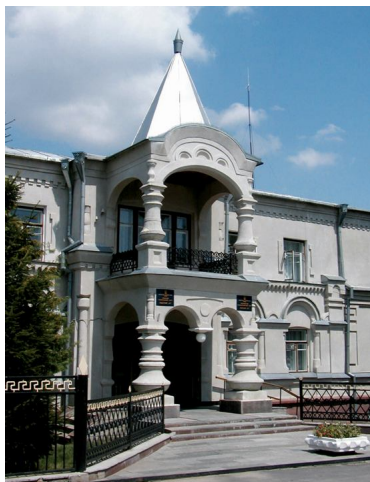
Санаторій МВС "Південний Буг"

Сьогодні над Південним Бугом височать оточені деревами та квітниками сучасні багатоповерхові корпуси обласної водолікарні, восьми санаторіїв, де одночасно лікуються й відпочивають сотні людей. Хворі із задоволенням відпочивають у парках, створених на березі Південного Бугу, де висаджено понад 200 видів дерев і чагарників, діють спортбази, станція човнів, літній кінотеатр.