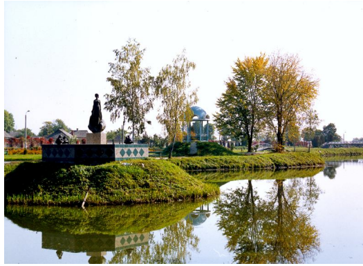
Медичний реабілітаційний центр залізничників Південно-Західної залізниці