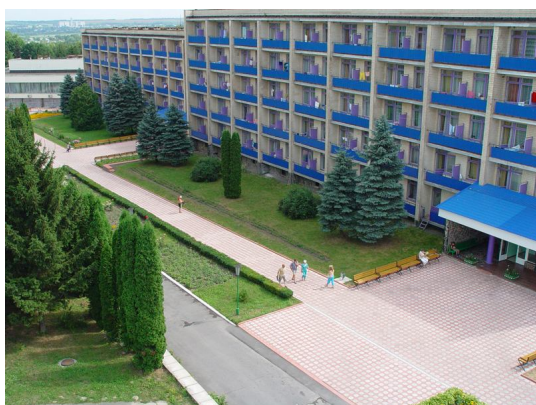
Клінічний санаторій Хмільник