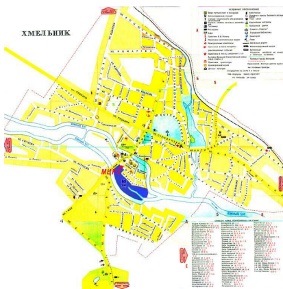
Мапа міста Хмільник

Адміністративний центр району – м. Хмільник (місто районного підпорядкування з 1957 р., місто обласного значення з 26.11.1979 р.)