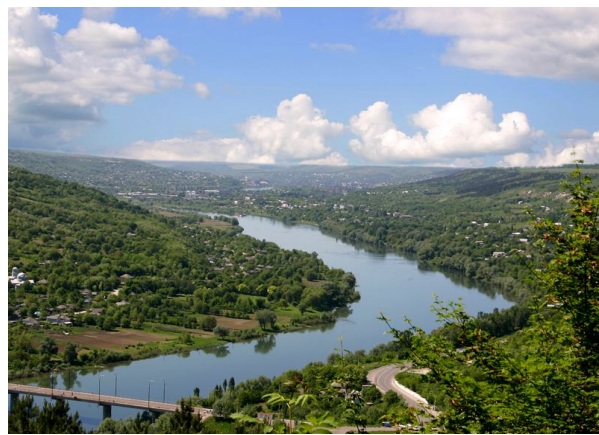
Панорама з Бронницької гори

Кожного приїжджого заворожить мальовничий краєвид, якщо глянути на місто з Озаринецької, Шаргородської чи Бронницької гори. На одній з її маківок колись була фортеця. Досі збереглися рештки мурів, підземні ходи, печери, велетенські камінні брили. Фортеця служила для захисту Могилева від турків і волоських феодалів. З боку Дністра вона дійсно була неприступною. Дещо пізніше на місці фортеці збудували чудовий палац і заклали парк рідкісних порід дерев.