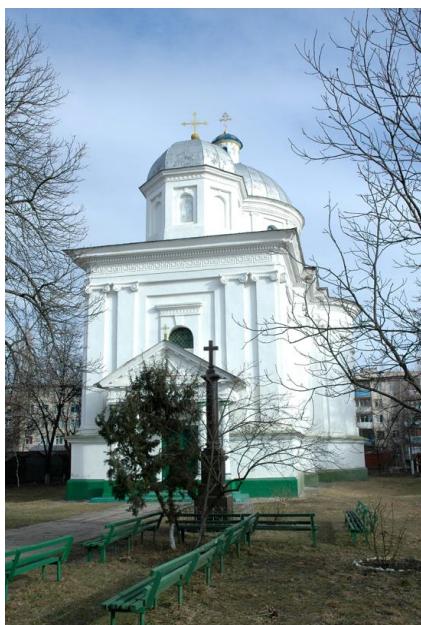
Кам'яний храм Святого Георгія Побідоносця – вул.Параскеївська,14, тел. (04337) 2-47-97