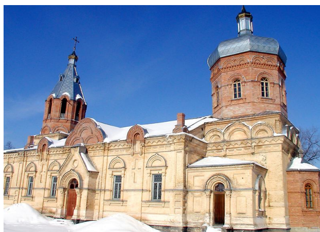
Церква Святого Олександра Невського – вул. Майдан Невського,1, тел.(04337)-2-44-69

Парафія Римсько-католицької церкви «Відвідини Пресвятою Дівою Марією Святої Єлизавети» – вул. Володимирська, 15,