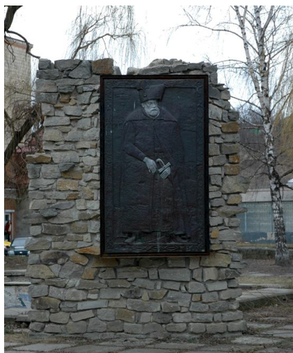
Пам'ятний знак Ісєремії Могилі

З історичних документів відомо, що у першій половині XV ст. на місці теперішнього Могилева при гирлі річки Дерло існувало село Іванківці. Знатний молдовський феодал Ярема Могила на правах приватної власності придбав Іванківці і в 1595 р заклав основу майбутнього міста, побудував замок і подарував його своєму зятеві брацлавському магнату Стефану Потоцькому, який із вдячності тестеві назвав містечко Могилевом. На перехресті вулиць Київської та Володимирської вдячні земляки спорудили у 1998 р. пам'ятний знак на честь засновника міста, який виготовив скульптор Микола Крижанівський.