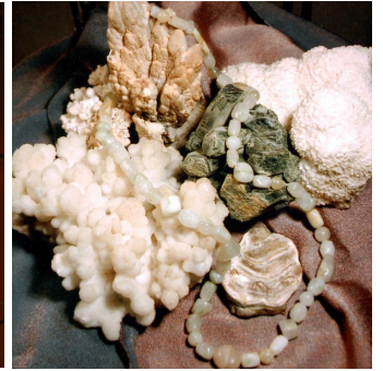
Краєзнавчий музей у Могилеві-Подільському

Краєзнавчий музей у Могилеві-Подільському розмістився в архітектурній пам'ятці – будинку місцевого купця Гальперіна, який був збудований у 1909 р. Його експозиційна частина представлена у 4-х залах, де до огляду представлені перлини музейної колекції, а саме: сарматський котел VI-VI ст. до н.е., і унікальні знаряддя побуту Трипільської культури, колекція зброї періоду XVI-XVIII ст., козацькі стріли та турецька нарізна рушниця, зброя і спорядження періоду Великої Вітчизняної війни, подільська вишивка та витинанка. Є тут і картини Григорія Бронштейна, роботи українських, російських та грузинських майстрів. Великою популярністю у відвідувачів користується колекція мінералів Володимира Петровича Афанасьєва, яка нараховує 1267 примірників унікальних рідкісних каменів – самоцвітів, рудовмісних з'єднань та зооморфних форм.