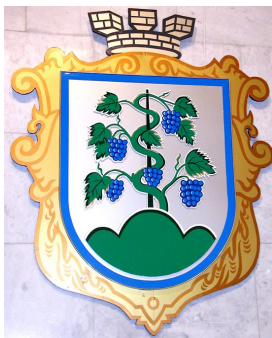
Герб м. Могилів-Подільський