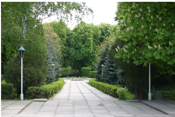
Парк культури і відпочинку ім. Лесі Українки

Радо приймають туристів туристичний комплекс «Дністер», санаторій «Гірський», який має лікувальну воду «Бронничанка». Щороку тисячі дітей відпочивають та лікуються у міському оздоровчому таборі «Наддністрянський» та комплексі відпочинку машинобудівників, що розташований у мальовничому місці біля річки Мурафи. Гостей міста розміщують у своїх апартаментах готелі «Турист» та «Олімп». До послуг гостей новий готель «Смарагд», який збудовано за всіма європейськими стандартами.