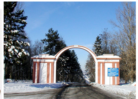
Арка на честь 300-річчя возз'єднання України з Росією

Могилів-Подільський... Місто, історія якого в кожній хвилині – від сивої давнини до сьогодення – наповнена хвилюючими, цікавими, героїчними подіями. Це чудове місто багате й різноманітне. Поєднавши у собі різні епохи й періоди, Могилів - Подільський належить до найкрасивіших міст Вінниччини зі своєю неповторною природною та архітектурною своєрідністю, яке має власне обличчя, тільки йому притаманний неповторний колорит, свою славу.