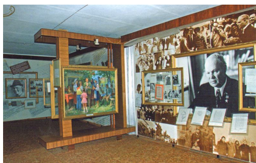
Літературно-меморіальний музей М.П.Стельмаха. Фрагмент експозиції музею, с.Дяківці