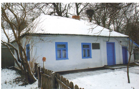
Меморіальна садиба М.П.Стельмаха, с.Дяківці

Свято бережуть односельці пам'ять про свого славетного земляка. Є у Дяківцях вулиця письменника, в одному з дворів стоїть доглянута отча хата і стара дідівська клуня. А до 77-ї річниці від дня народження майстра слова був відкритий у селі літературний музей його імені. За рішенням Вінницької обласної ради літературно-меморіальний комплекс М.Стельмаха внесено до списку перлин Поділля.