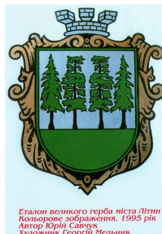
Еталон великого герба міста Літин Кольорове зображення, 1995 рік Автор Юрій Савчук Художник Георгій Мельник

Краю мій зелений, вічная дорога, Ти безсмертник в полі, в небесах гроза – Припаду я серцем до твого порога, Як твоя кровинка, як твоя сльоза.